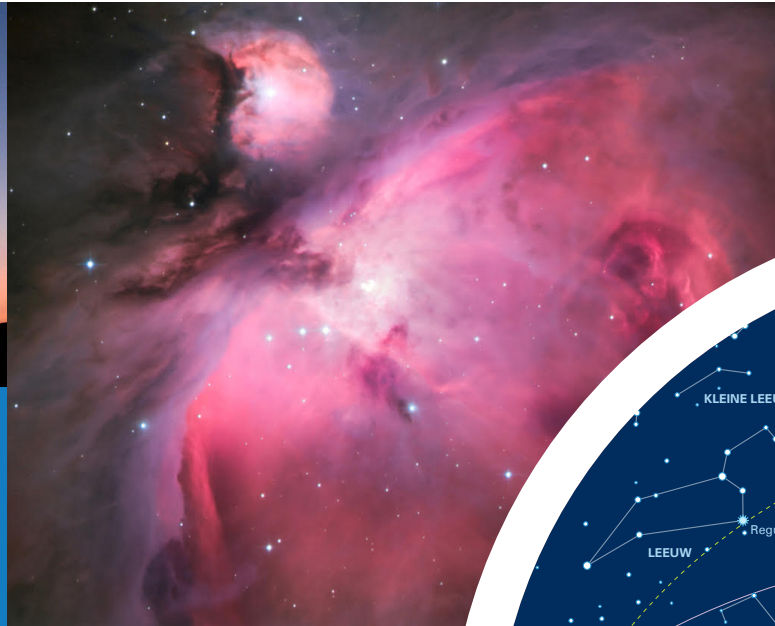
▲ Een amateurfoto van de Orionnevel (M42) in het gelijknamige sterrenbeeld.

De Landelijke Sterrenkijkdagen zijn het grootste en langstlopende sterrenkijkevenement van Nederland. Dit jaar is het de 48ste editie en het evenement wordt georganiseerd onder de vlag van de Koninklijke Nederlandse Vereniging voor Weer- en Sterrenkunde (KNVWS).